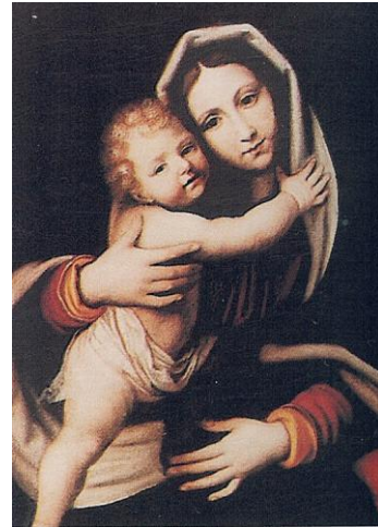
« Vierge de la Société »

Le 21 novembre 1800, elle fit à Paris son premier engagement religieux. Un an plus tard une première communauté s'installa à Amiens, dont elle fut rapidement nommée supérieure. La congrégation qui, pour des raisons politiques, ne put prendre le nom de Société du Sacré-Cœur qu'en 1815, s'étendit peu à peu, à Grenoble puis à Poitiers où s'ouvrit le premier noviciat. Elle fut nommée Supérieure générale à 26 ans. Désormais la vie de Madeleine Sophie Barat se confond avec celle de la Société du Sacré-Cœur qu'elle dirige. Elle sillonne la France et l'Europe, allant partout où elle est appelée pour créer des pensionnats. Et elle tient à ouvrir à côté de chacun d'eux une école gratuite, parfois un orphelinat, où affluent les petites filles pauvres pour lesquelles, à l'époque, il n'existait pas d'établissement communal d'instruction.